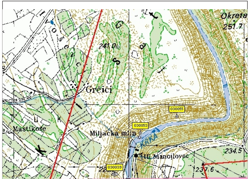
Spljaski sustav Miljacka I i Miljacka V Izdavac: Križanec, Križ NP Krka

1984 S.Božičević, 1998 SoŽ, 2001, SOV, SJP PUŠK, 2016 SOV,SOŽ,HBSD, SPSvM,SU Breganja, 2017-2018 SoŽ,HBSD, SOŽ Gospić, SOV,Swierznycki, HYLA